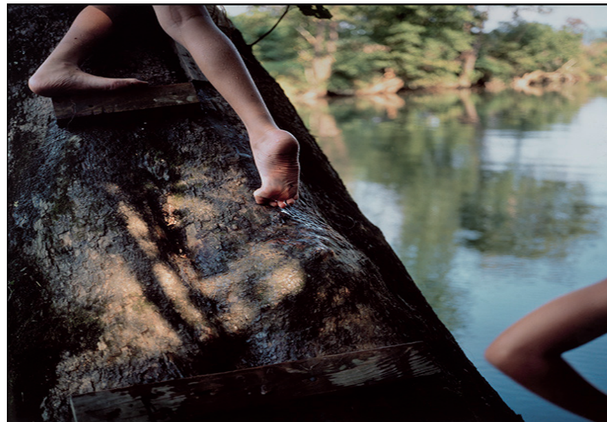
SALLY MANN, Mille et un passages

Ce que peut dire la photographie sur un territoire (le sud des États-Unis) et son histoire (depuis les années 1980).